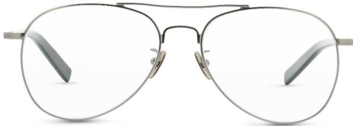
Lunor Aviator P2 II PP | UVP: 423,- €

Pressebüro LUNOR - c/o Convensis PR Friedrichstraße 23b - 70174 Stuttgart