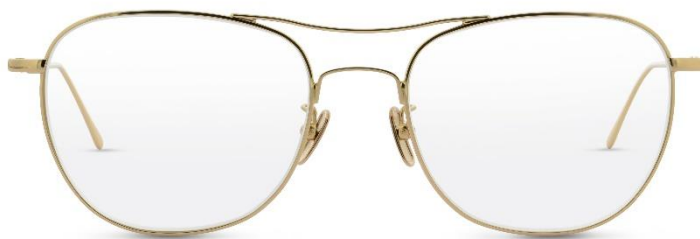
Lunor Aviator P2 II GP | UVP: 380,- €