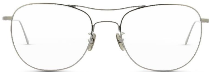
Lunor Aviator P2 II PP | UVP: 380,- €

Pressebüro LUNOR - c/o Convensis PR Friedrichstraße 23b - 70174 Stuttgart