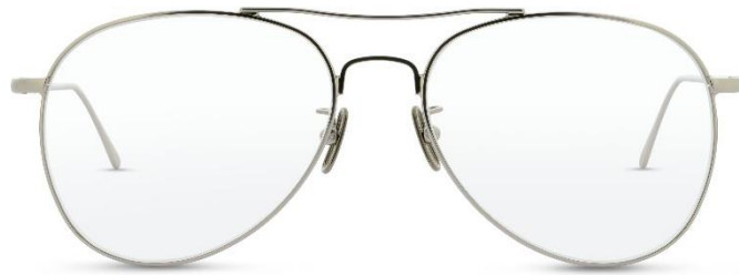
Lunor Aviator P2 II PP | UVP: 380,- €

Pressebüro LUNOR - c/o Convensis PR Friedrichstraße 23b - 70174 Stuttgart