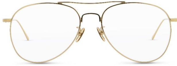
Lunor Aviator P2 II GP | UVP: 380,- €